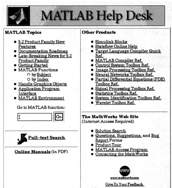
图2-3 启动MATLAB Help Desk后显示的索引页